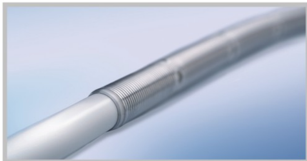
插管末端与穿刺套心之间平滑过渡