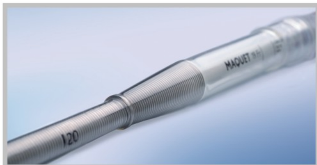
终止环限定了插入深度